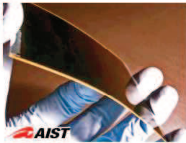
Obrázok 1 CIGS modul [2]

Podobné alebo väčšie účinnosti v priemyselnom výrobnom procese fotovoltaických článkov sa dosiahli v [3]. Výpočty preukázali, že je možné dosiahnuť účinnosť okolo 20 % v bórom dopovanom kyslíkom kontaminovanom kremíku.